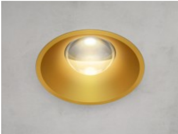
Aluminium Abschlussring Gold eloxiert.