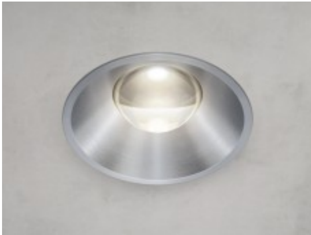
Aluminium Abschlußring gesotcht und zaponiert.